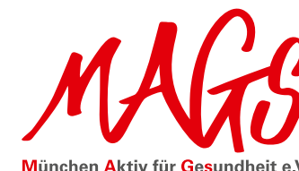
und das Team von MAGS