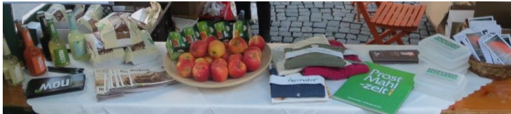
Ernährungsquiz mit Sponsorenpreisen