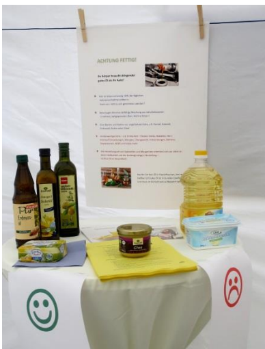
Achtung fettig! Ihr Körper braucht dringender gutes Öl als Ihr Motor!