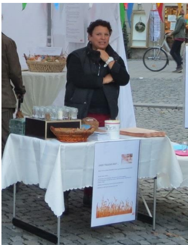
Unser täglich Brot ... Wissen Sie aus welchen Rohstoffen Ihr Brot und Ihre Brötchen gebacken sind?