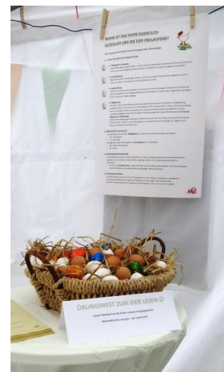
Wann ist das Huhn eigentlich glücklich und die Eier freilaufend? Die Lösung steht auf dem Ei!